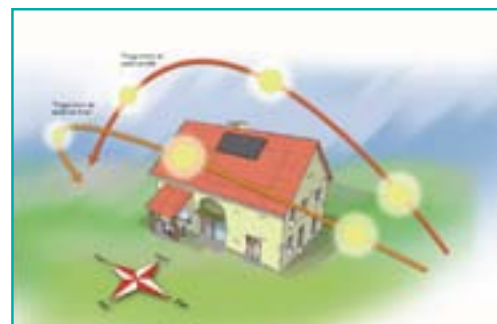
Une façade principale au sud, dégagée en hiver des ombres des bâtiments voisins ou d'arbres persistants, permet de profiter au mieux du rayonnement solaire.

Aussi, pour être conforme aux nouvelles exigences, le « Bbio_{projet} » (calculé par le bureau d'étude thermique à l'aide d'un logiciel agréé RT 2012) doit être inférieur au « Bbio_{MAX} ». A l'instar de la Cep_{MAX} , le Bbio_{MAX} est modulable en fonction des mêmes critères.