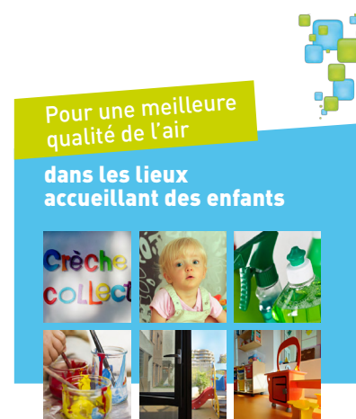
Guide pratique 2016