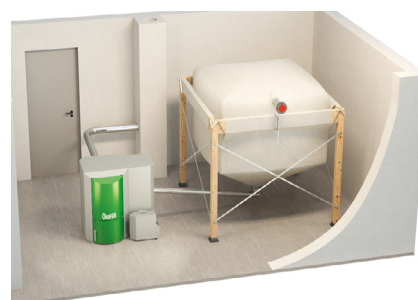
Silo intérieur textile