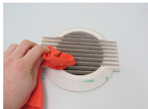
Les grilles d'aérations se nettoient régulièrement et un système de VMC s'entretient annuellement.

Une maison étanche à l'air nécessite une ventilation mécanique pour assurer le renouvellement de l'air intérieur.